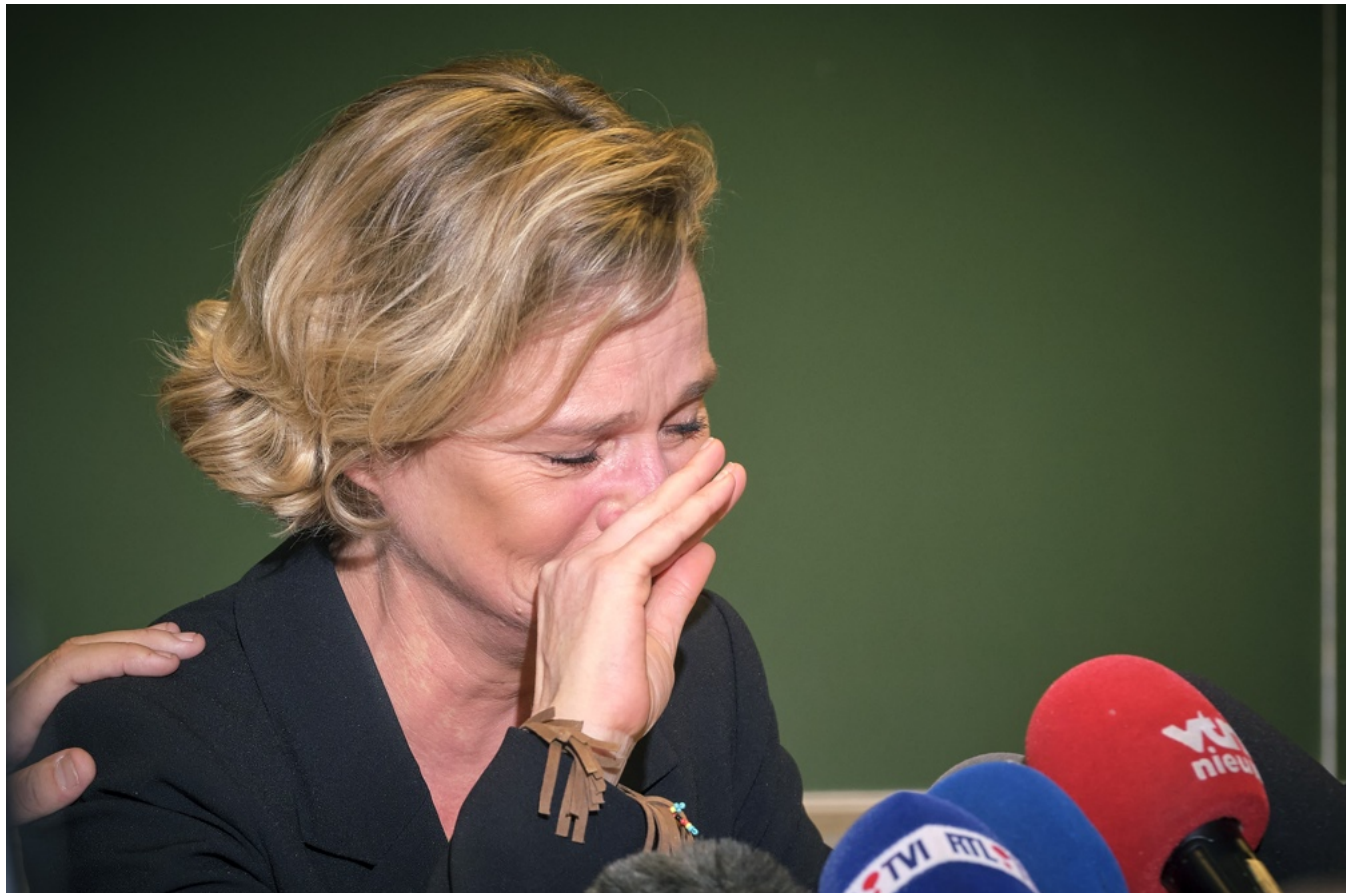
Delphine werd tijdens de persconferentie heel emotioneel.