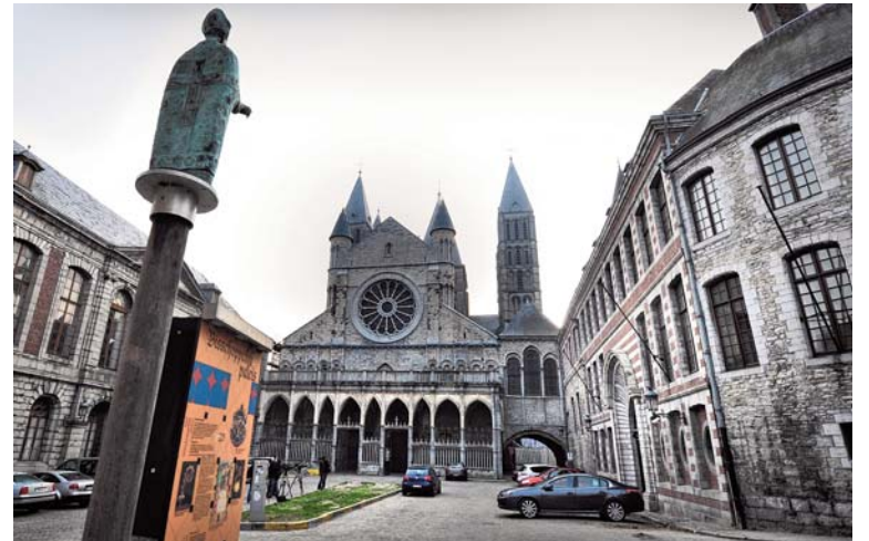
► Devillé: “Waar blijven de resultaten van Operatie Kelk? Wáár wachten die op?”

In de samenleving? Zeker wel. Zie de #MeToo-beweging. En dat is nog maar een begin, volgens mij. Ook het kindermisbruik is niet verdwenen. In de kerk zal het probleem kleiner zijn dan vroeger. Omdat de kerk kleiner is, maar ook door de nieuwe bewustwor-